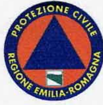
Protezione Civile Regione Emilia-Romagna