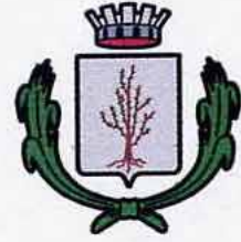
Comune di Spilamberto