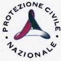
Protezione Civile Nazionale