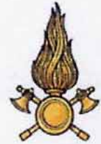
Vigili del Fuoco